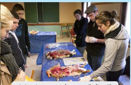
Animations autour des appareils digestifs