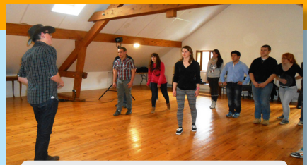
Théâtre du Peuple : «Apprendre à s'exprimer !»

Ce BTS PA se fait en contrat de professionnalisation géré par le FAFSEA (Fonds National d'Assurance Formation des Salariés des Exploitations et Entreprises Agricoles) ou en contrat d'apprentissage . Le contrat sera aidé sur 2 ans.